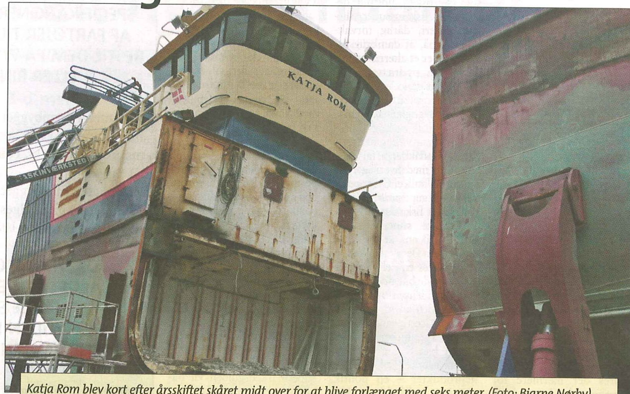
Katja Rom blev kort efter årsskiftet skåret midt over for at blive forlænget med seks meter.