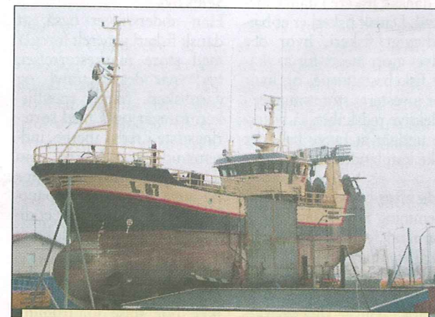
Den blev købt til fordeling af kvoten mellem fem fiskere, da den blev opkøbt uden udsigt til fortsat fiskeri, men nu forlænges den, og skal igen på fiskeri i marts.